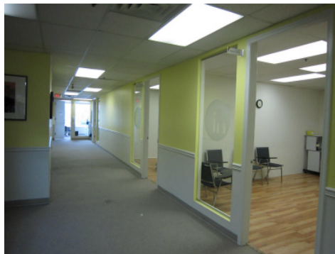
廊下です。明るく、廊下も広く 取られています。