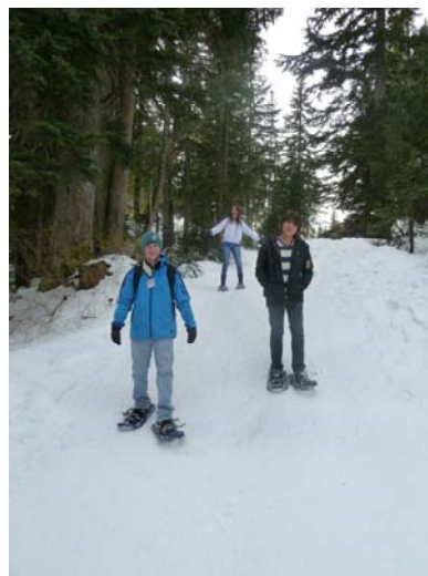
スノーシューアクティビティー