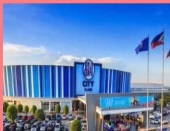
SMシティクラーク（ショッピングモール） ユニクロやスターバックスもあります