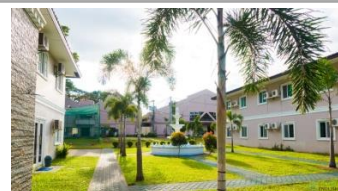
コンパクトながら明るく開放的なキャンパス