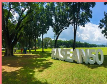
クラークエリア内は緑あふれる環境