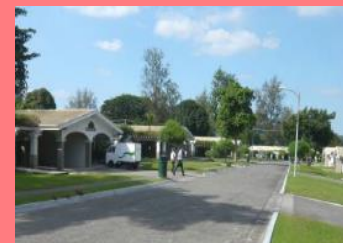
アメリカンテイスト漂う街並み