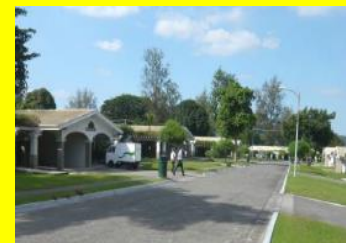
アメリカンテイスト漂う街並み