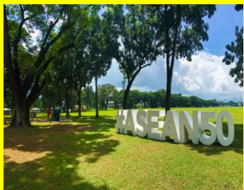
クラークエリア内は緑あふれる環境