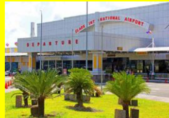
空港から学校まですぐ！