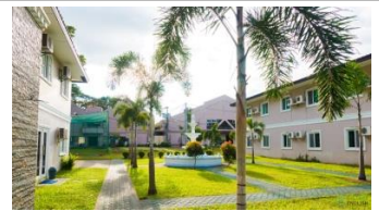
コンパクトながら明るく開放的なキャンパス