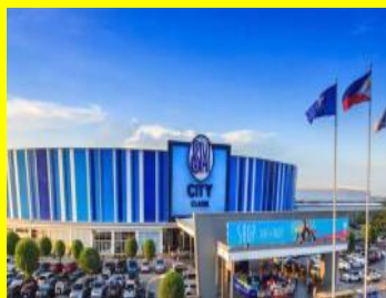
SMシティクラーク（ショッピングモール） ユニクロやスターバックスもあります