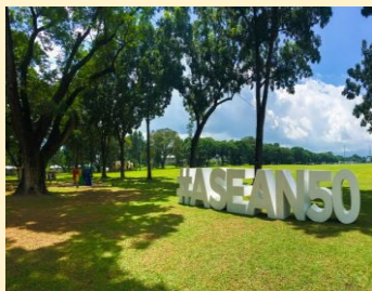
クラークエリア内は緑あふれる環境