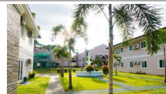
コンパクトながら明るく開放的なキャンパス