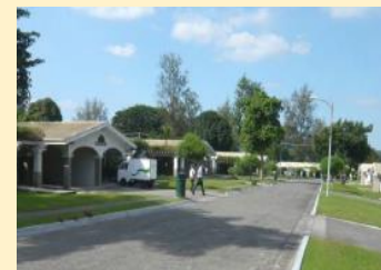
アメリカンテイスト漂う街並み