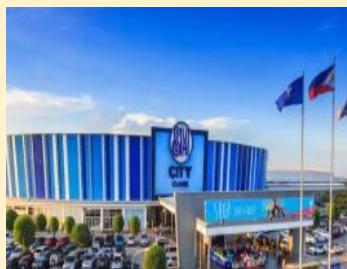
SMシティクラーク（ショッピングモール） ユニクロやスターバックスもあります