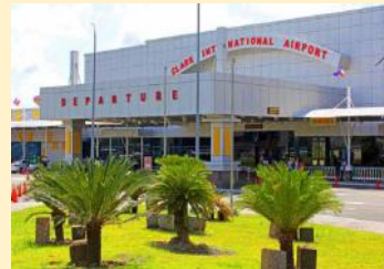
空港から学校まですぐ！