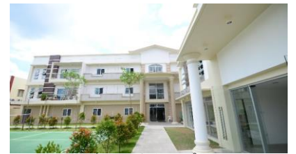
広々としたキャンパス