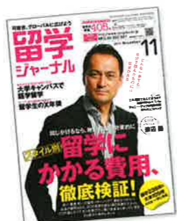
自社発行の媒体で、「人生の変化は海外体験がきっかけ」と訴える留学ジャーナル。大学の秋入学への動きにも積極的に応じる